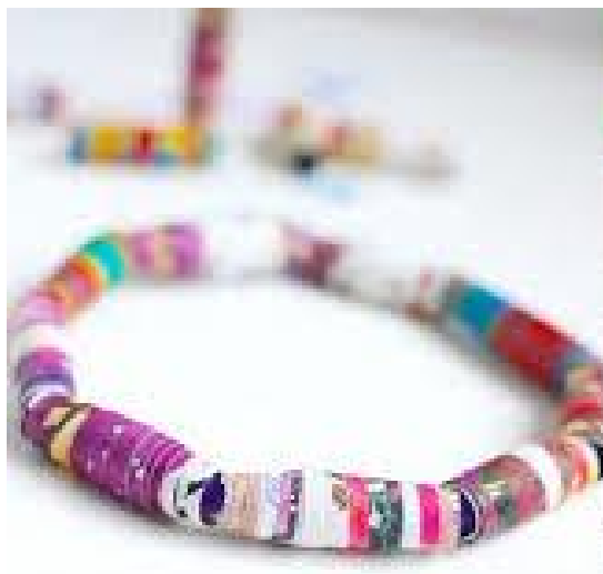
Narukvica od slamčica u boji