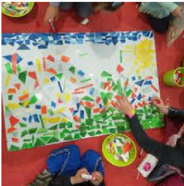
Slika od kolaž papira