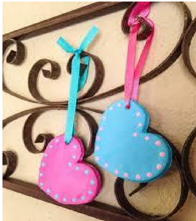
Srca od glinamola