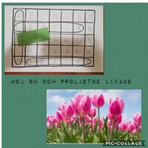
Moj dom su proljetne livade.