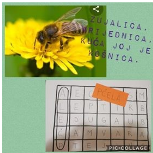
Zujalica, vrijednica, kuća joj je košnica.

Rješenja u osmosmjerki su proljetni pojmovi koje možete otkriti odgovorom na zadane zagonetke.