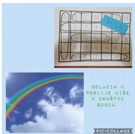
Dolazim poslije kiše, društvu sunca.

Postavite svom predškolcu izazov da pogodi pojam, ispiše riječ na papir i onda je pronađe u sadržaju osmosmjerke. Prikazana aktivnost sadrži veći broj radnji koje dijete može samostalno realizirati i svakako ga uključite u proces organizacije i provedbe aktivnosti.