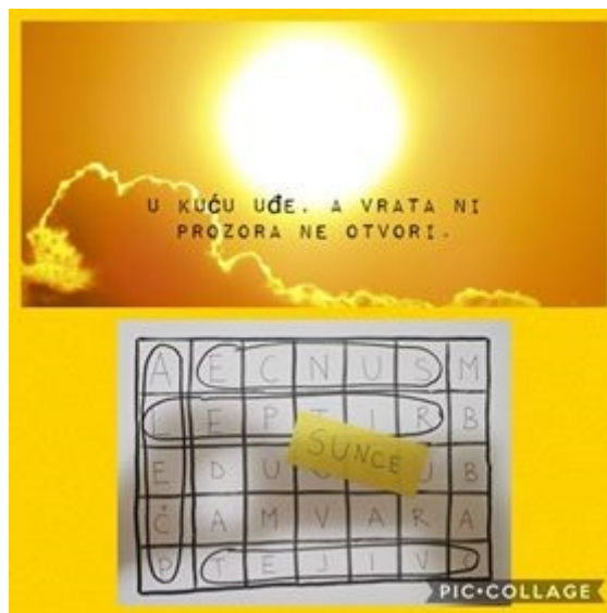
U kuću uđe, a vrata, ni prozore ne otvori.