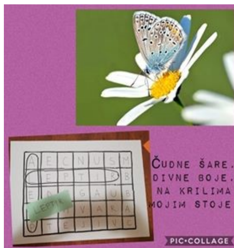
Čudne boje, divne šare na krilima.